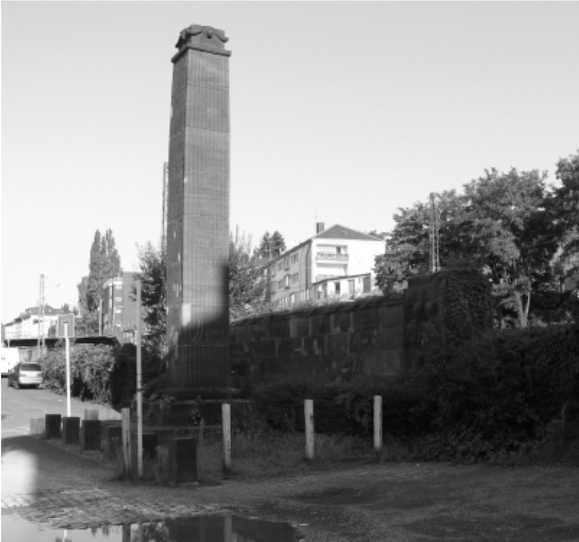
Das Denkmal neben der Barmer Post im Sommer 2008

Das Langemarck-Denkmal in Wuppertal-Barmen