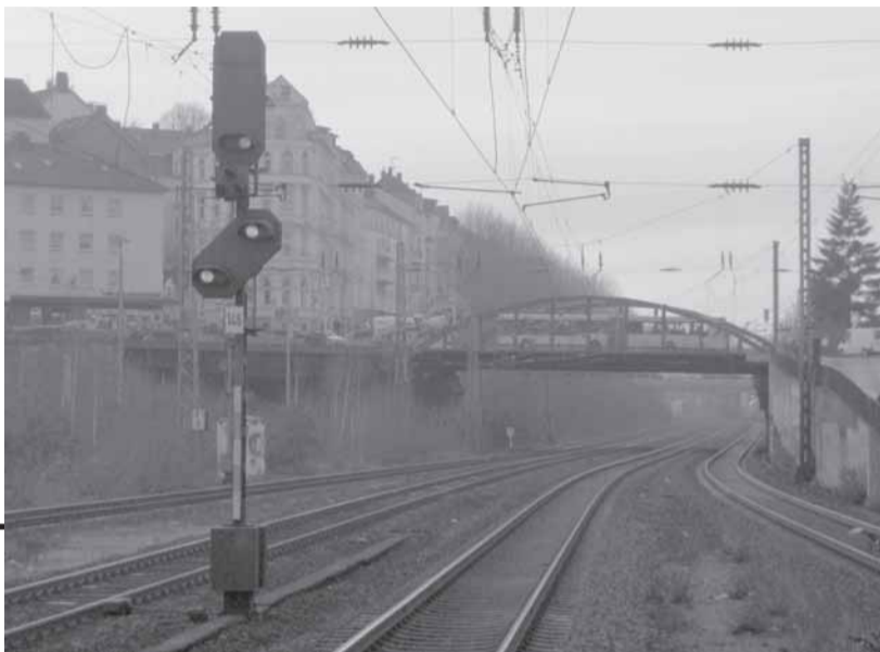
Über die Brücke Emilienstraße fahren täglich die Buslinien 628, CE 61, der Nachtexpress 5 sowie zahlreiche Schulbusse.

auf die Fußgängerbrücke Erichstraße als Alternative verwiesen, die angeblich nur 100 Meter entfernt sei.